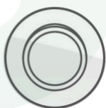
Diseño de rueda universal