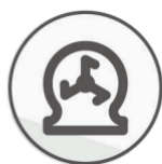
Rendimiento de trabajo estable