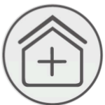
Apto para sala de operaciones