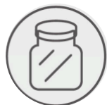
Tecnología anti desbordamiento