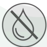
Bomba de pistón sin aceite